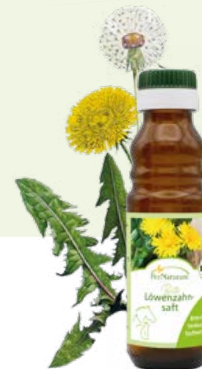
Bio Löwenzahnsaft ab 100 ml Zertifiziert durch LACON DE-ÖKO-003

Wenn Sie von Trockenfutter umstellen, kombinieren Sie es nicht in einer Mahlzeit mit Fleisch. Und kochen Sie das Fleisch die ersten Tage noch ab, dann ist es leichter verdaulich – oder nehmen Sie unsere Fleischdosen. Bitterstoffe helfen dem Körper, mit der Umstellung besser fertig zu werden. Sie fördern die Sekretion von Verdauungssäften. Besonders Löwenzahnsaft erleichtert die Umstellung auf sanfte Art und Weise und unterstützt gleichzeitig Leber, Nieren und die Bauchspeicheldrüse. Garon forte hilft sofort bei dünnem Kot, so dass der Nahrungsbrei lang genug zur Nährstoffaufnahme im Darm verweilt.