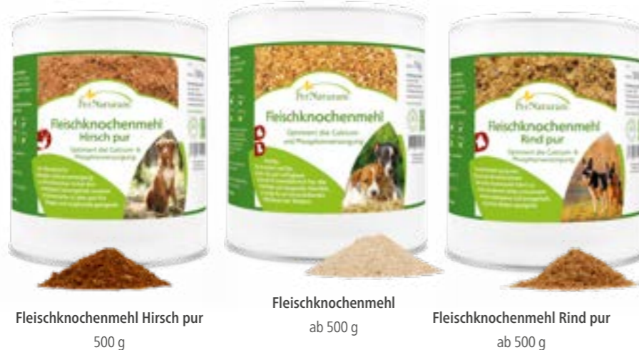
Fleischknochenmehl Hirsch pur 500 g

Für die Zahnreinigung können außerdem Fellstreifen, getrocknete Lunge oder Pansen, am besten in Kombination mit Ascodent Plus , gegeben werden. So arbeiten Sie prophylaktisch gegen Zahnstein.