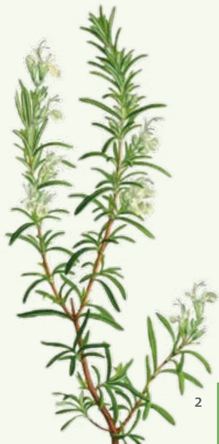
Rosmarin ( Salvia rosmarinus )