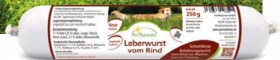
Leberwurst vom Rind 250 g