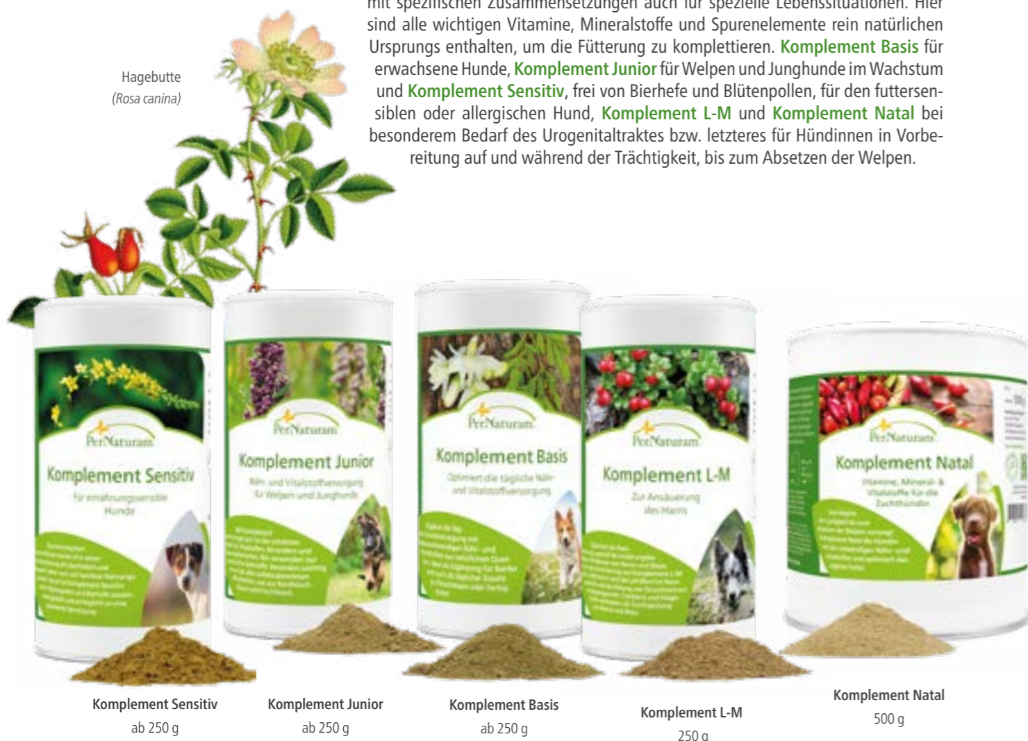
Hagebutte (Rosa canina)

Um sowohl das Defizit an Vitalstoffen im Fleisch als auch den fehlenden Fell- und Krallenanteil auszugleichen, bietet PerNaturam Ihnen die Komplement-Familie , mit spezifischen Zusammensetzungen auch für spezielle Lebenssituationen. Hier sind alle wichtigen Vitamine, Mineralstoffe und Spurenelemente rein natürlichen Ursprungs enthalten, um die Fütterung zu komplettieren. Komplement Basis für erwachsene Hunde, Komplement Junior für Welpen und Junghunde im Wachstum und Komplement Sensitiv , frei von Bierhefe und Blütenpollen, für den futtersensiblen oder allergischen Hund, Komplement L-M und Komplement Natal bei besonderem Bedarf des Urogenitaltraktes bzw. letzteres für Hündinnen in Vorbereitung auf und während der Trächtigkeit, bis zum Absetzen der Welpen.