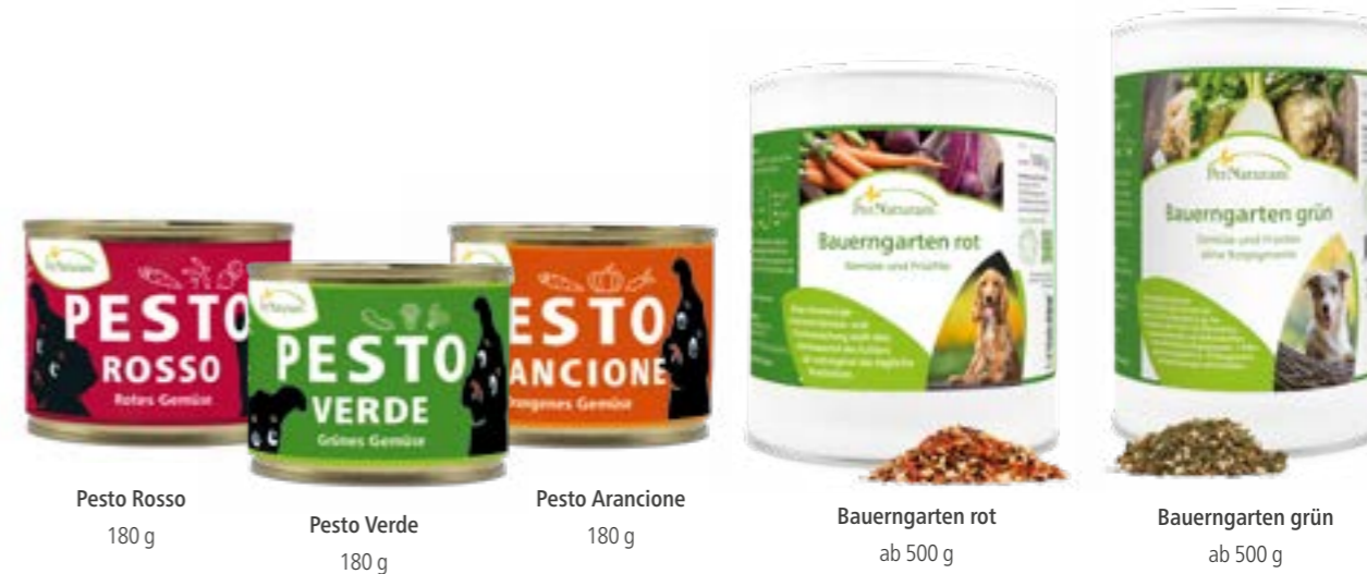
Pesto Rosso 180 g

Wer nicht jeden Tag mixen oder kochen möchte kann stattdessen zu dem Möhrengrenulat greifen. Noch vielfältiger und abwechslungsreicher ist der Bauerngarten in verschiedenen Variationen. Er ersetzt die vorverdaute pflanzliche Nahrung und die Faseranteile im Magen und Darm des Beutetiers. 100 g Bauerngarten werden dabei aus 1 kg frischem Gemüse hergestellt. Als feuchte Variante bietet sich ein Pesto an. Diese eignen sich auch sehr gut, um Pulver unter das Futter zu mischen.