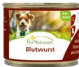
Blutwurst vom Schwein 200 g