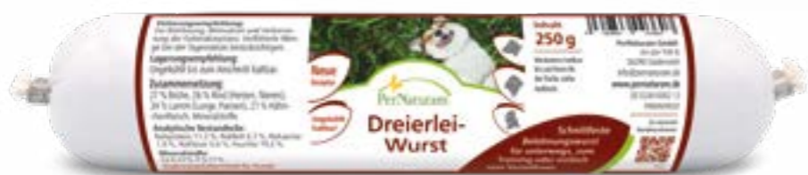
Dreierlei-Wurst 250 g