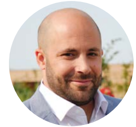
Thajgoro De Longhi

Um auf individuelle Bedürfnisse, speziell in Zeiten mit besonderem Bedarf, einzugehen, bewähren sich Heilpflanzen in gezielter Zusammenstellung gerade bei Geflügel. Denn auf Grund ihrer hohen Stoffwechselaktivität, zeigt sich die natürliche Wirkung der Pflanzenkombinationen erstaunlich schnell. Unsere Geflügellinie, bietet mit den Avis-Produkten einen natürlichen Mehrwert, sowohl während der Aufzucht, in der Mauser, in der Wettflugsaison der Brieftauben oder einfach im heimischen Garten.