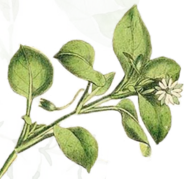
Gewöhnliche Vogelmiere ( Stellaria media )