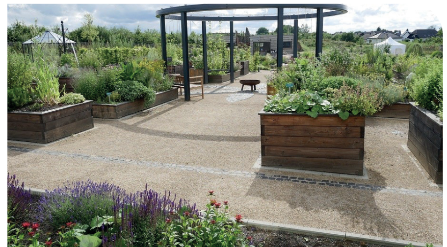
Hortus Juni 2022

Der Garten soll aber auch die heilkundlichen Kräfte und die spirituellen Energien der Pflanzen vermitteln. Wir sehen es als wesentlichen Teil unserer Arbeit an, die Botschaften der Pflanzen zu verstehen und für andere verständlich zu machen.