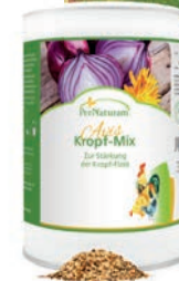
Avis Kropf-Mix 2024

auch wissenschaftlicher zu formulieren. Lancelot Mischung , Immun-Stärkungs-Tee , 30 Kräutergarten und die Lüneburger Kräuter Mischung kamen damals ins Programm, all das noch bei den Brieftauben. Bis heute im Programm sind u.a. Usnotica , Enterogan , Kolostrum-Produkte , Garon , Zellschutz-Antistress . Alles Produkte, die damals in Nörvenich entwickelt wurden.