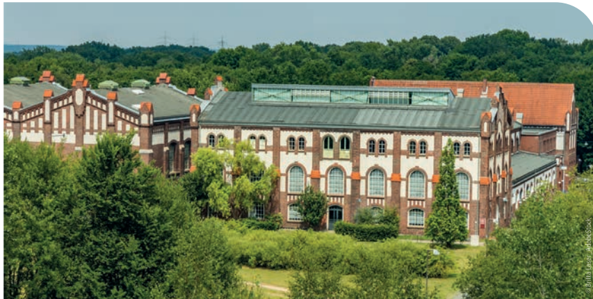
Ehemalige Zeche Waltrop heute Sitz manufactum