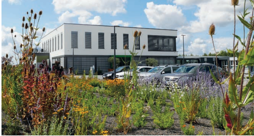
2018 wurde das neue Verwaltungsgebäude eingeweiht.