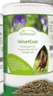
VelvetCoat 900 g | 38,00 €