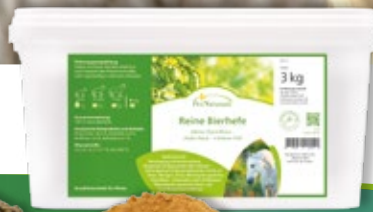
Reine Bierhefe 3 kg | 22,00 €