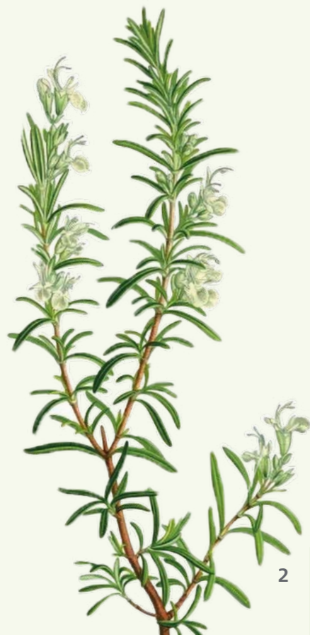
Rosmarin ( Salvia rosmarinus )