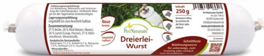
Dreierlei-Wurst 250 g