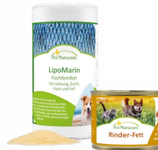
LipoMarin — Fischfett 250 g

Hier können Sie mehr zum Thema Stärke und deren Auswirkung auf den Organismus lesen.