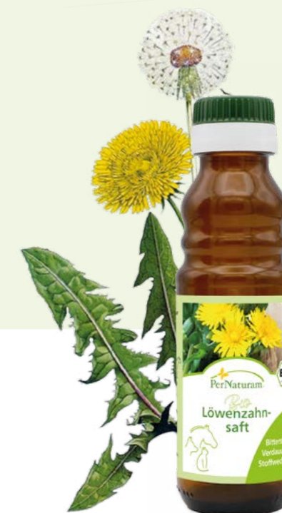
Bio Löwenzahnsaft ab 100 ml Zertifiziert durch LACON DE-ÖKO-003

Wenn Sie von Trockenfutter umstellen, kombinieren Sie es nicht in einer Mahlzeit mit Fleisch. Und kochen Sie das Fleisch die ersten Tage noch ab, dann ist es leichter verdaulich – oder nehmen Sie unsere Fleischdosen. Bitterstoffe helfen dem Körper, mit der Umstellung besser fertig zu werden. Sie fördern die Sekretion von Verdauungssäften. Besonders Löwenzahnsaft erleichtert die Umstellung auf sanfte Art und Weise und unterstützt gleichzeitig Leber, Nieren und die Bauchspeicheldrüse. Garon forte hilft sofort bei dünnem Kot, so dass der Nahrungsbrei lang genug zur Nährstoffaufnahme im Darm verweilt.