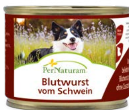
Blutwurst vom Schwein 200 g