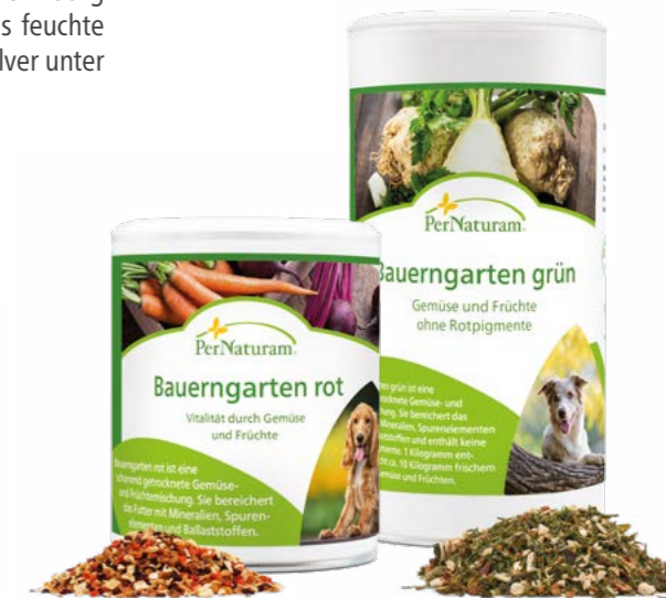
Bauerngarten rot ab 150 g