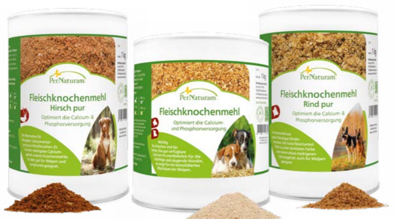
Fleischknochenmehl Hirsch pur ab 500 g

Für die Zahnreinigung können außerdem Fellstreifen, getrocknete Lunge oder Pansen, am besten in Kombination mit Ascodent Plus , gegeben werden. So arbeiten Sie prophylaktisch gegen Zahnstein.