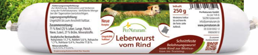
Leberwurst vom Rind 250 g