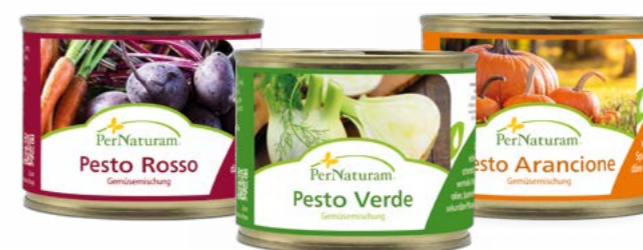
Pesto Rosso 190 g

Wer nicht jeden Tag mixen oder kochen möchte kann stattdessen zu dem Möhrengrenulat greifen. Noch vielfältiger und abwechslungsreicher ist der Bauerngarten in verschiedenen Variationen. Er ersetzt die vorverdaute pflanzliche Nahrung und die Faseranteile im Magen und Darm des Beutetiers. 100 g Bauerngarten werden dabei aus 1 kg frischem Gemüse hergestellt. Als feuchte Variante bietet sich ein Pesto an. Diese eignen sich auch sehr gut, um Pulver unter das Futter zu mischen.